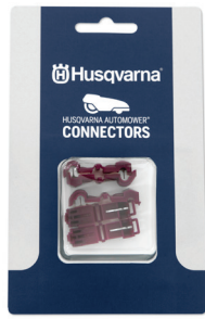
KLEMME FÜR ANSCHLUSS AN LADESTATION 577 86 48-01