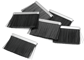
RADBÜRSTENSATZ (300 SERIE, 400 & 500 SERIE AWD) 505 13 28-03