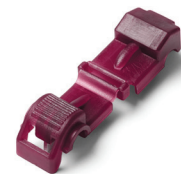
ANSCHLUSSKLEMME (1 ST.) 535 12 90-01