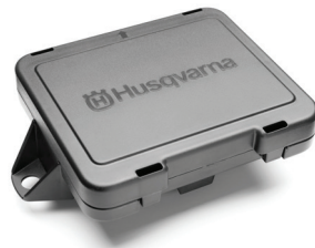
AUTOMOWER® CONNECTOR PROTECTION BOX 599 80 17-01