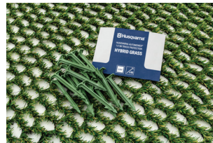
HUSQVARNA HYBRID-GRAS KIT 598 89 60-01