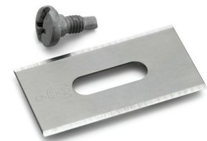
AUTOMOWER® ENDURANCE KLINGEN 595 08 44-01