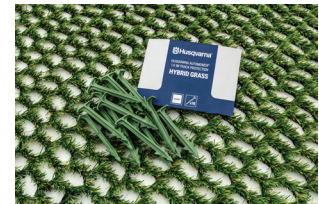
HUSQVARNA AUTOMOWER® HYBRID-GRAS KIT 598 89 60-02