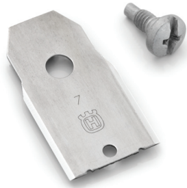
HUSQVARNA AUTOMOWER® ENHANCE HSS BLADES 599 80 53-01