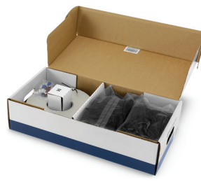
HUSQVARNA INSTALLATIONS-KIT M 967 97 22-01