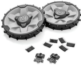
OFFROAD-KIT 310/315 INKL. BÜRSTEN 587 23 53-01