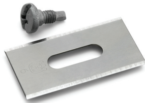
AUTOMOWER® ENDURANCE KLINGEN 595 08 44-02