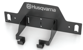
HUSQVARNA AUTOMOWER® WANDHALTERUNG 585 01 97-02