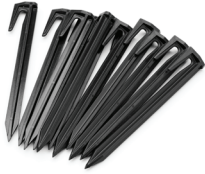
KLAMMERN KUNSTSTOFF 583 97 34-01