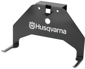
WANDHALTER AUTOMOWER 587 22 40-01