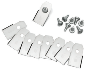
MESSER MIT ZWEI SCHNEIDEN 0,60 MM, KARBON, 9 ST. 577 86 46-03