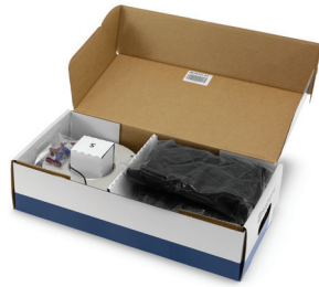
HUSQVARNA INSTALLATIONS-KIT S 967 97 21-01