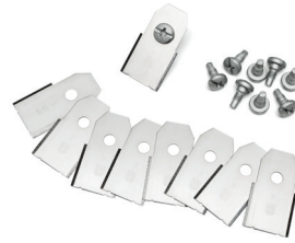
MESSER MIT ZWEI SCHNEIDEN 0,60 MM, KARBON, 45 ST. 577 60 65-05