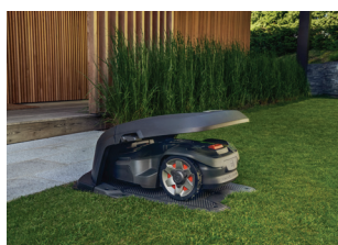
AUTOMOWER® GARAGE 536 66 41-01