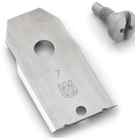
AUTOMOWER® ENHANCE HSS BLADES 599 80 53-02