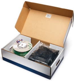
INSTALLATIONS-KIT L 967 62 36-03