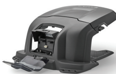
HUSQVARNA AUTOMOWER® GARAGE 305/310/315/315X/405X/415X 587 23 61-01