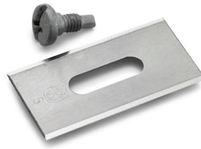
AUTOMOWER® ENDURANCE HSS BLADES 599 80 52-03