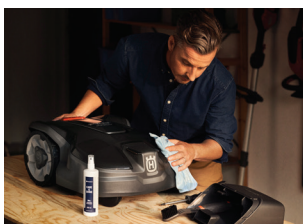
AUTOMOWER® WARTUNGS- UND SCHUTZSTECKERHÜLLE REINIGUNGS-KIT 590 85 51-01