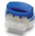
KABELVERBINDER (1 STK.) 501 98 02-01