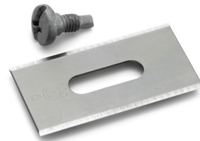
AUTOMOWER® ENDURANCE KLINGEN 595 08 44-03