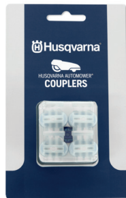
KABELVERBINDER 577 86 47-01