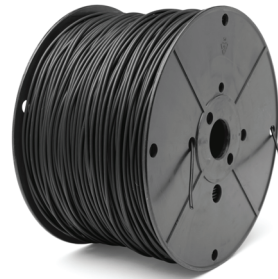
HUSQVARNA AUTOMOWER® BEGRENZUNGSKABEL HEAVY DUTY Ø3.4MM - 500 M 522 91 41-02