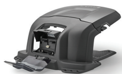
AUTOMOWER® GARAGE 420/430X/440/450X/520/550 585 01 94-01