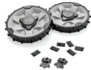
OFFROAD-KIT 420/430X/450X INKL. BÜRSTEN 581 88 97-02