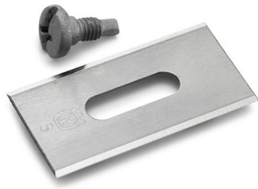
AUTOMOWER® ENDURANCE HSS BLADES 599 80 52-02