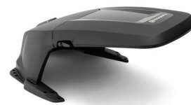
AUTOMOWER® GARAGE 597 63 53-01