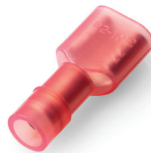
VERBINDER 529 28 08-01