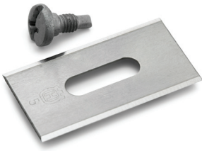
HUSQVARNA AUTOMOWER® ENDURANCE KLINGEN 599 80 52-01