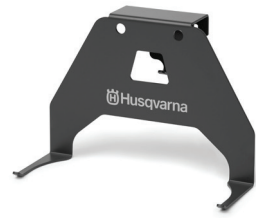
WANDHALTER AUTOMOWER 597 70 36-01