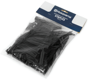
HUSQVARNA AUTOMOWER® BODENHAKEN 577 86 42-01