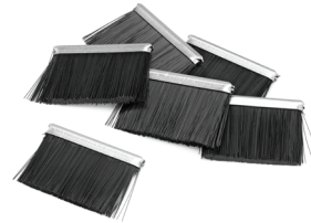
RADBÜRSTENSATZ 6 ST., BLISTERPACK 581 98 20-02