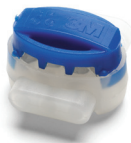
KABELVERBINDER 501 98 02-03