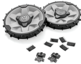
OFFROAD-KIT AUTOMOWER® 305 597 70 54-01