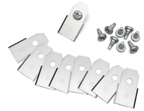
MESSER MIT ZWEI SCHNEIDEN 0,60 MM, KARBON, 300 ST. 577 60 66-04